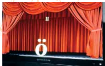
Eiríkur Örn Norðdahl